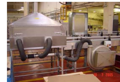
ΜΠΟΥΚΑΛΙΑ - ΚΟΝΣΕΡΒΕΣ - ΒΑΖΑ - ΠΛΑΣΤΙΚΑ ΔΟΧΕΙΑ ΜΕΤΑ ΤΟ ΠΛΥΣΙΜΟ / ΓΕΜΙΣΜΑ ΠΡΙΝ ΤΗΝ ΕΚΤΥΠΩΣΗ / ΕΤΙΚΕΤΑ