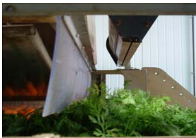
ΛΑΧΑΝΙΚΑ - ΠΑΤΑΤΕΣ - ΝΟΠΑ ΠΡΟΙΟΝΤΑ ΜΕΤΑ ΤΟ ΠΛΥΣΙΜΟ ΠΡΙΝ ΤΗΝ ΣΥΣΚΕΥΑΣΙΑ