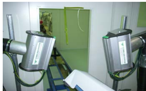
ΚΑΘΑΡΙΣΜΟΣ ΑΠΟ ΣΚΟΝΕΣ - ΞΕΝΑ ΣΩΜΑΤΙΑ ΠΡΙΝ ΤΗΝ ΕΚΤΥΠΩΣΗ / ΒΑΦΙΜΟ ΤΑΥΤΟΧΡΟΝΗ ΒΕΟΧΑΛΕΤΕΡΩΣΗ ΣΤΑΤΙΚΟΥ ΗΛΕΚΤΡΙΣΜΟΥ